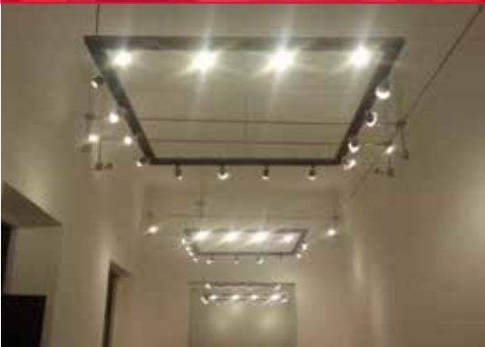
Diseño iluminación, Cuernavaca, Mor.