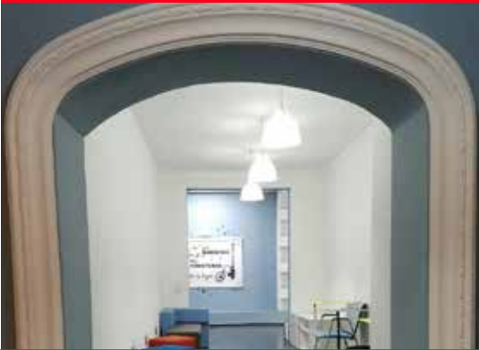
Retrofit comercial, CDMX