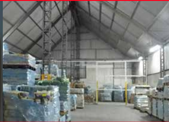
Industrial Retrofit, Celaya, Gto.