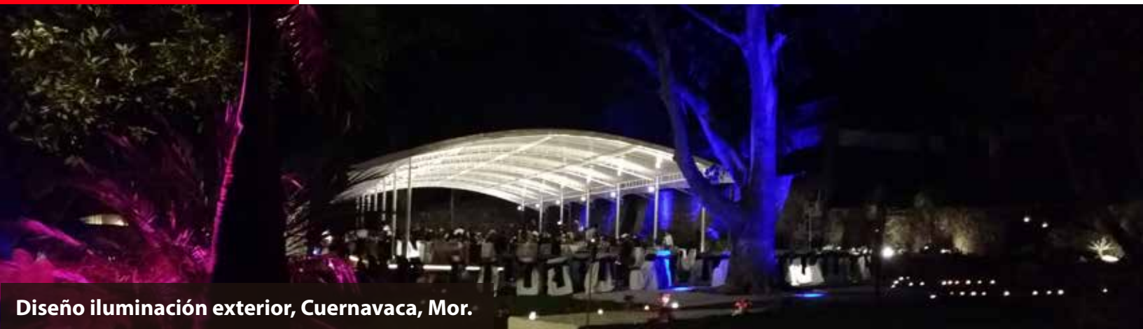
Diseño iluminación exterior, Cuernavaca, Mor.