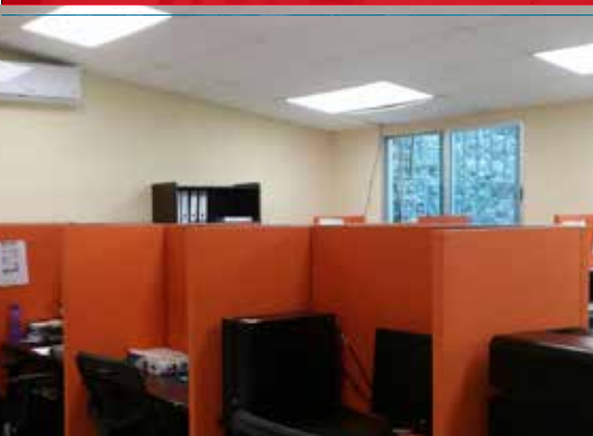
Diseño comercial, Cuernavaca Mor.