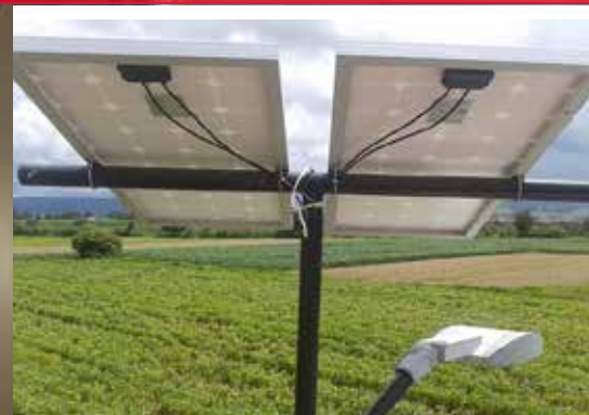
Generación energía, Edo de Mex.