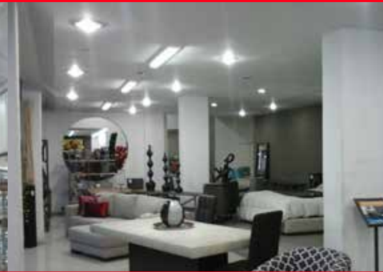
Retrofit comercial, Edo de Mex.