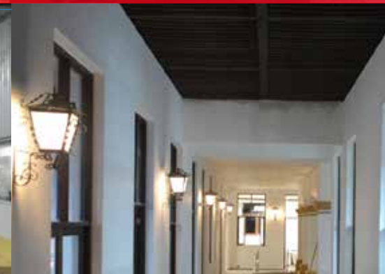
Diseño iluminación, Cuernavaca Mor.

mejoratuespacio.com Diseño & sustentabilidad ahorra@mejoratuespacio.com