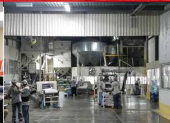
Industrial Retrofit, Celaya, Gto.